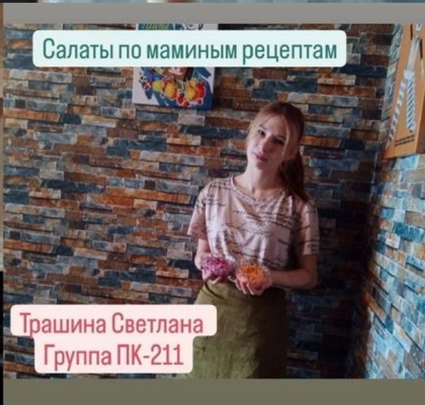
Салаты по маминым рецептам