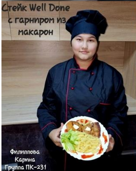
Стейк Well Done с гарниром из макарон